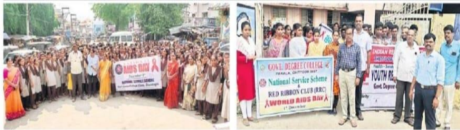
నరసింగాపురం, పాకాలలో విద్యార్థుల ర్యాలీ